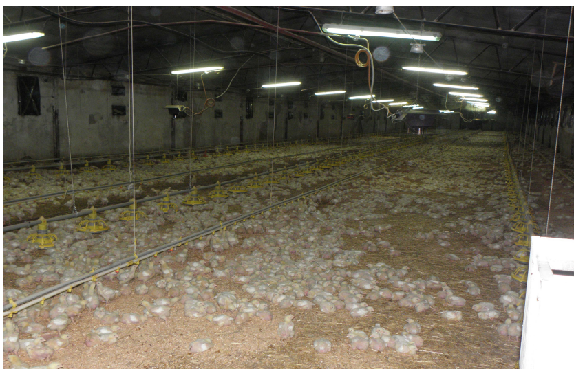
Hranilice, pojlilice, grijači