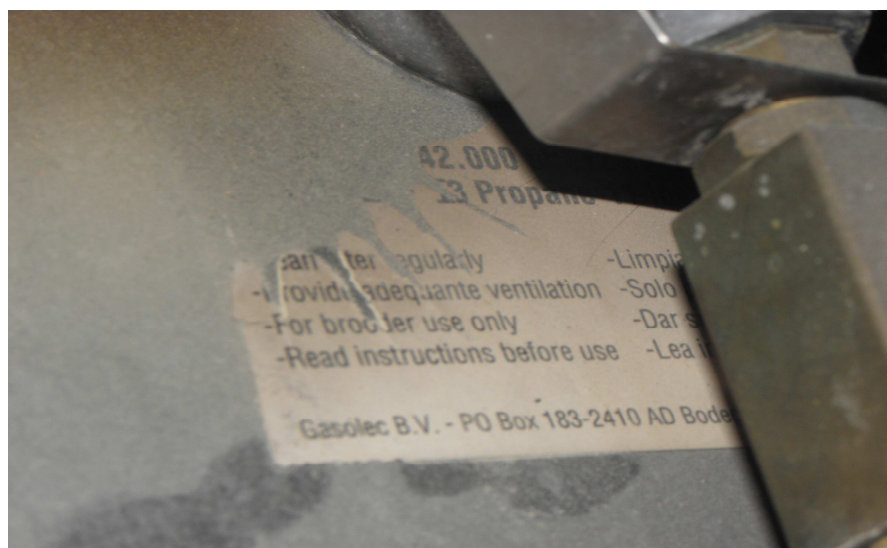
grijač Gasolec detalj