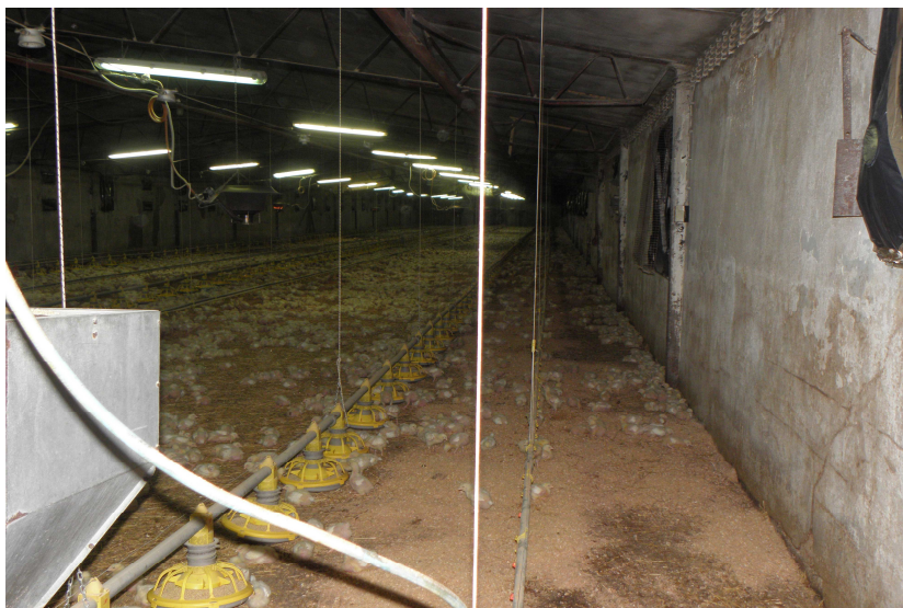
Hranilice, pojlilice, grijači