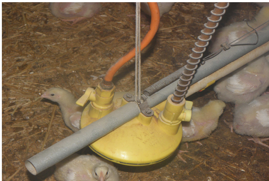
ulaz, razvod , regulacija