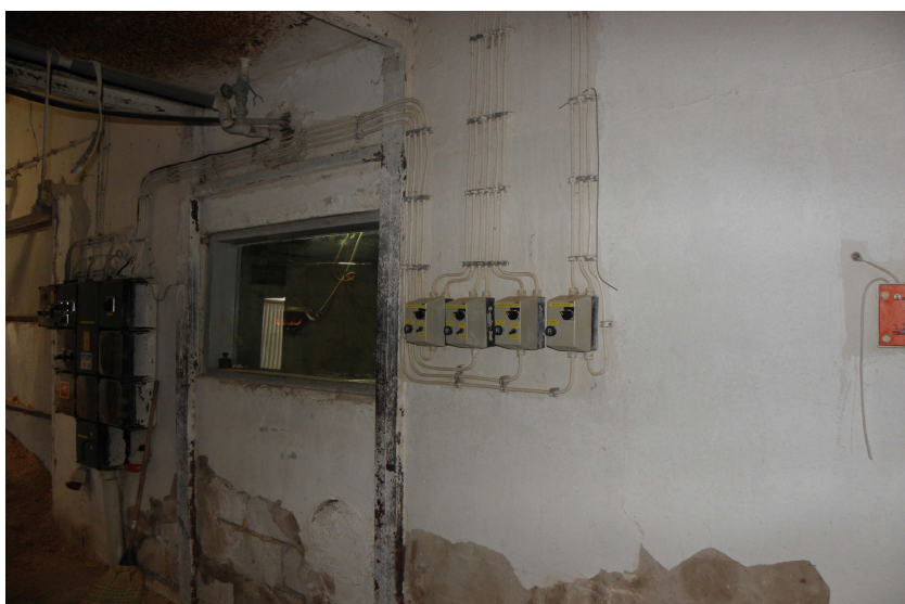
Električna jedinica za upravljanje radom opreme i rasvjete

1.3 Sve tri proizvodne jedinice imaju istu radnu opremu i rade na isti način. Raspored opreme u proizvodnoj jedinici potvrđuju slike u prilogu