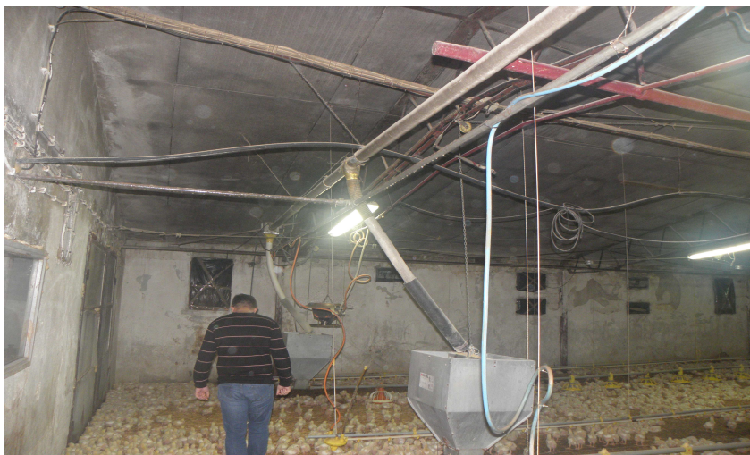
međusobni izgled svih elemenata linije za hranjenje