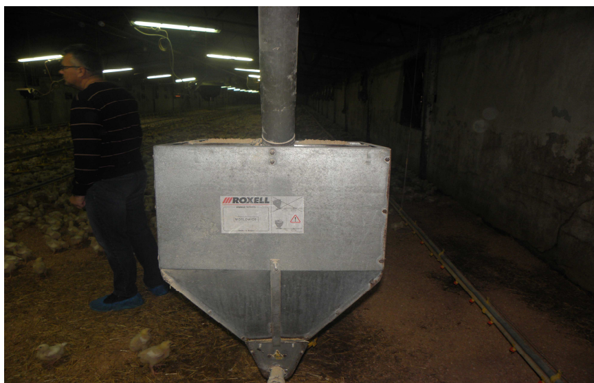
koš za hranu vidljiv proizvođač