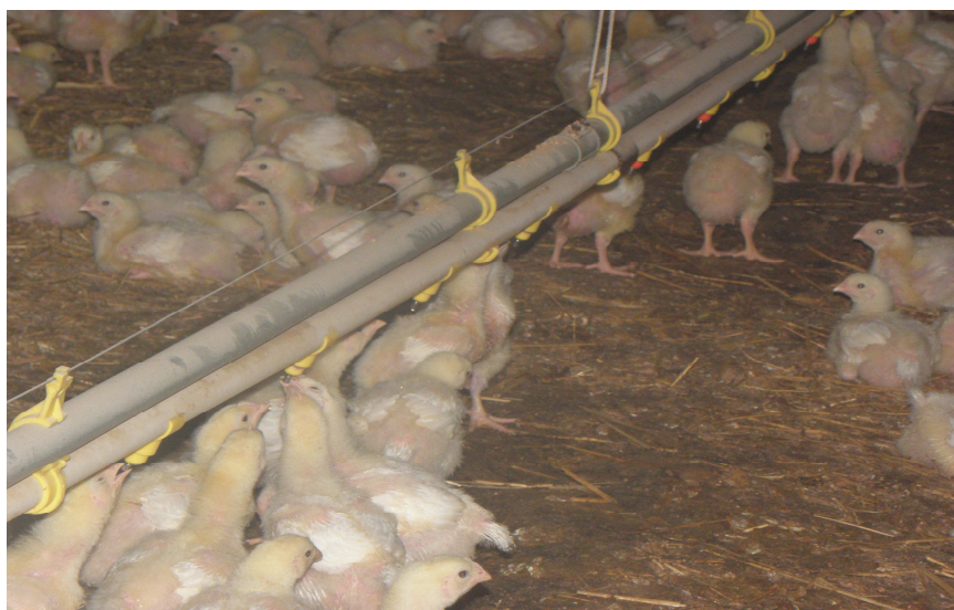
pojlisce - bradavice na cijevi